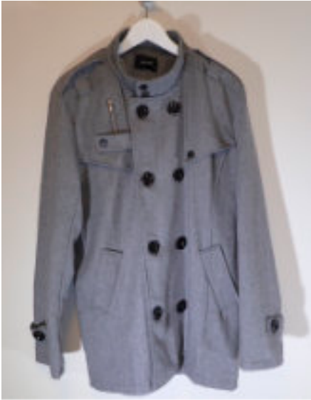
Två alldagliga plagg blev en unik kappa